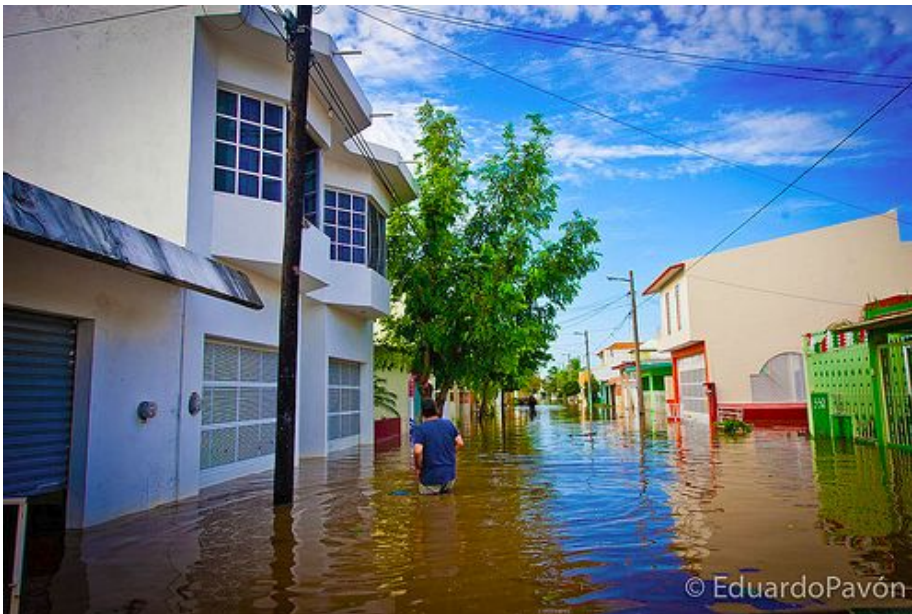
Efectos del Huracán Karl en Veracruz-México