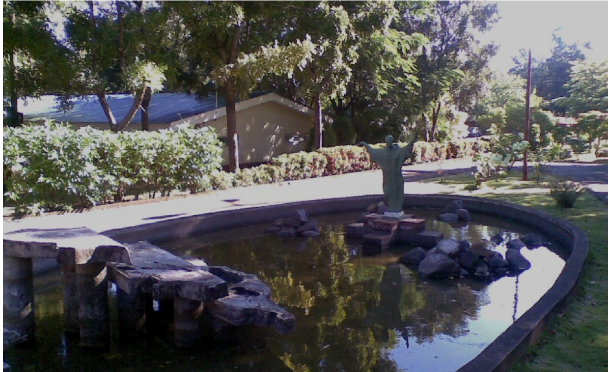
El ICCE de la UCC invitado al Primer Encuentro Calasanzio de Profesores de Nicaragua celebrado en el Colegio Calasanz de Managua

Nº 143, enero de 2012, número especial, Año 8, Etapa II