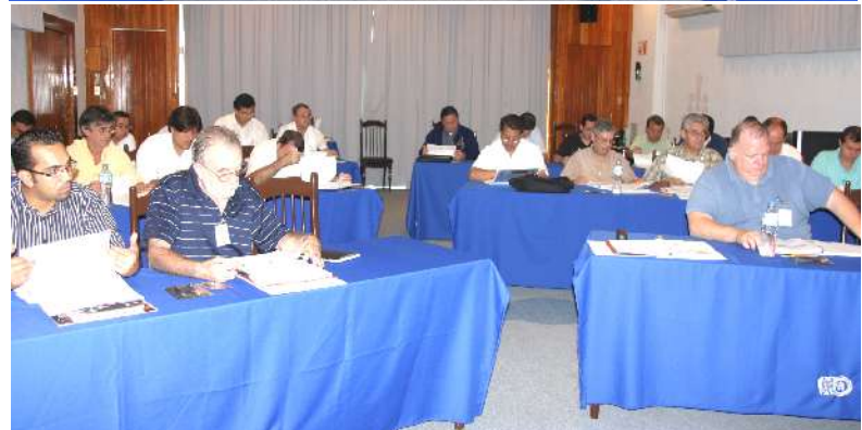
Importantes encuentros de Escolapios en Veracruz